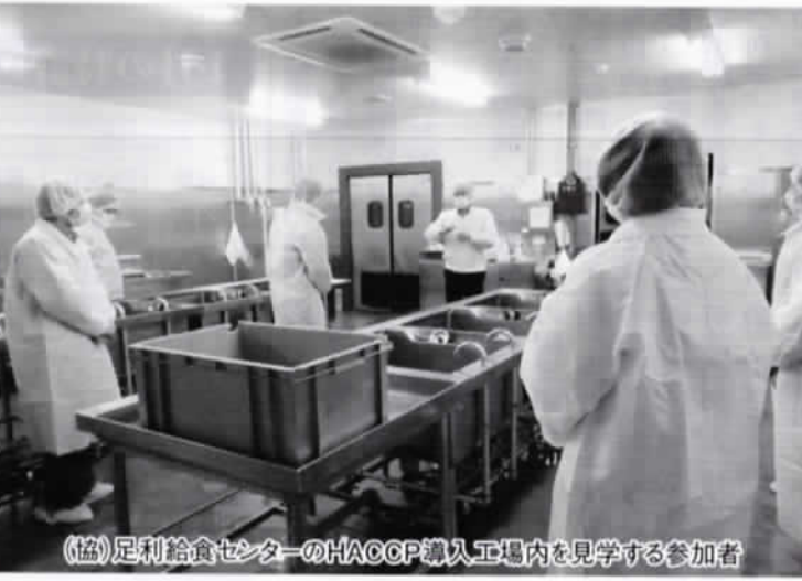
(協)足利給食センターのHACCP導入工場内を見学する参加者

HACCPが導入された工場内は、「清潔」「準清潔」「汚染」の3区域ごとに床面を色分けして、各作業室を完全に仕切るなど衛生面への配慮が色濃く見られ、参加者からは「社員の5Sへの意識の高さを感じた」との声が多かった。